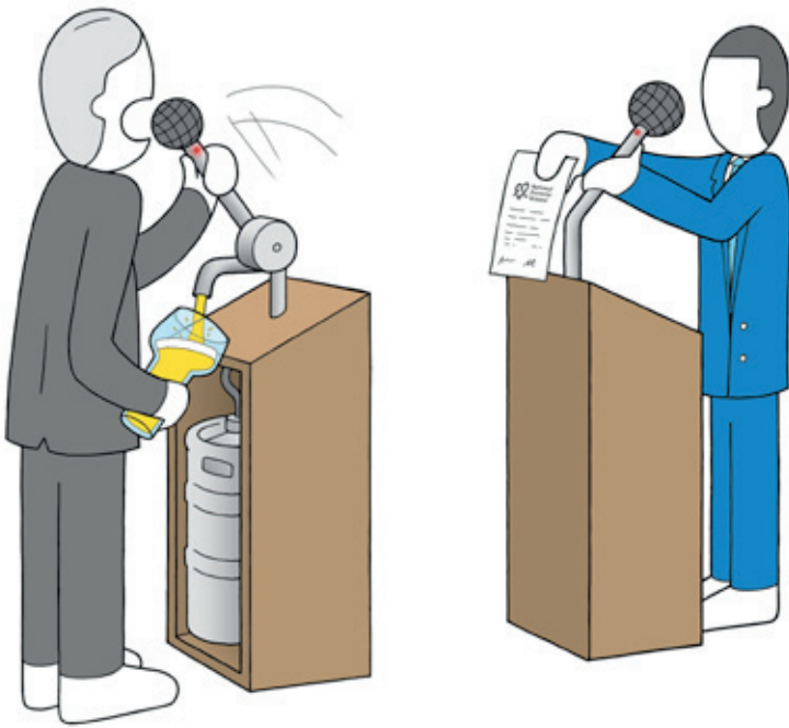
Kamerlid Ziengs (VVD) trekt zich met z'n wetsvoorstel over blurring niets aan van het Preventieakkoord van Blokhuis – tekening Tomas Schats

STAP geeft Blokhuis het voordeel van de twijfel en heeft daarom besloten de komende 1 à 2 jaar actief op te trekken met Blokhuis om hem helpen de plannen te verbeteren. Als er na die periode geen sprake is van een duidelijke voortuitgang zal STAP geen energie meer stoppen in de uitvoering van het Preventieakkoord.