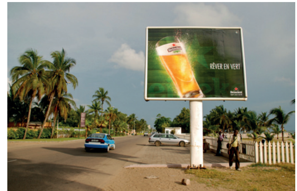
Dominante straatreclame Heineken in Pointe Noire (Congo-Brazzaville). 'RÊVER EN VERT': 'Droom in het groen'

STAP heeft tijdens de overleggen over het wereldgezondheidsbeleid geadviseerd om geen overheidsgeld meer te steken in projecten van Nederlandse alcoholproducten in ontwikkelingslanden waarbij geclaimd wordt dat deze projecten bijdragen aan economische vooruitgang. Onlangs nog heeft minister Sigrid Kaag (Buitenlandse Handel en Ontwikkelingssamenwerking) laten weten dat het Ministerie van Buitenlandse Zaken € 6,5 miljoen subsidie heeft verstrekt aan landbouwprojecten waarbij Heineken afnemer is van de oogst.