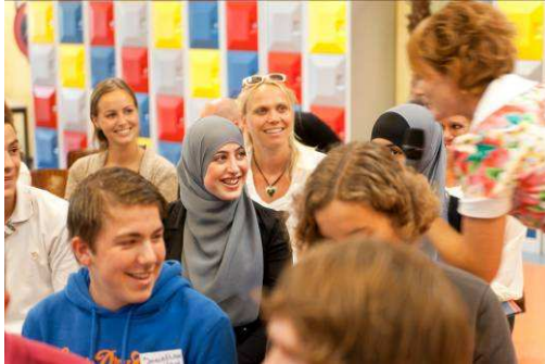
Pittige discussies kwamen op gang, er mocht ook gelachen worden

De discussie ging met name over alcoholvrije schoolfeesten: zijn die wel gezellig? Leerlingen en docenten die alcoholvrije feesten meegemaakt hebben, waren zeer enthousiast over deze feesten. Zij zijn dan ook van mening dat schoolfeesten heel gezellig kunnen zijn zonder alcohol. Leerlingen en docenten die feesten met alcohol gezellig vinden, zijn van mening dat als alcohol verboden gaat worden deze feesten in het water vallen. Ook is men op één school bang dat docenten geen toezicht meer willen houden omdat er geen biertje gedronken mag worden. Op deze school worden de schoolfeesten door een leerlingenvereniging georganiseerd. Daar heeft de school weinig invloed op de organisatie van de feesten en ook niet of alcohol wel of niet toegestaan is.