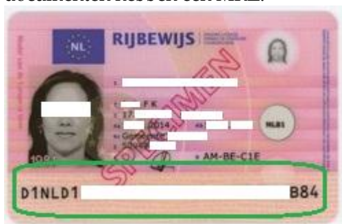
Figuur 1: De MRZ is de groen gemarkeerde regel onderaan (doorgehaald door het CBP).

Met de ID scanner kunnen diverse (buitenlandse) identiteitsdocumenten uitgelezen worden. Voorbeelden zijn identiteitskaarten, verblijfsvergunningen en paspoorten. Het uitlezen ervan kan op twee verschillende technische wijzen: (1) uitlezen van de Machine Readable Zone (MRZ), en (2) uitlezen met behulp van Radio Frequency Identification (RFID) techniek. De MRZ is een strook op het identiteitsdocument met lettertekens die geautomatiseerd kan worden uitgelezen. 58 Niet alle identiteitsdocumenten hebben een MRZ. 59