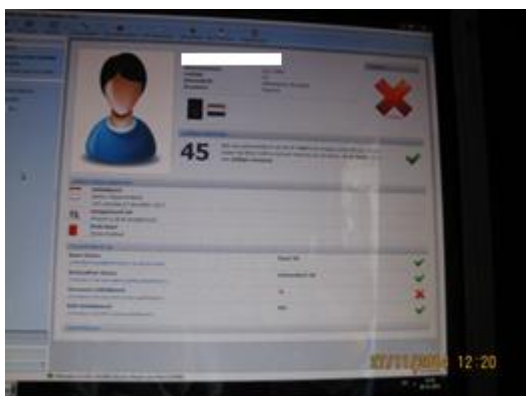
Figuur 3a: het rode kruis geeft aan dat aan de betrokkene een CHO is opgelegd (doorgehaald door het CBP).

De cafés hebben verklaard en het CBP heeft vastgesteld dat de cafés Collectieve horecaontzegging (CHO) en strafbaar feit (bij CHO) verzamelen en vastleggen van bezoekers van de horecagelegenheden. Van betrokkenen die een horecaontzegging hebben opgelegd gekregen verwerken de cafés naast bovengenoemde persoonsgegevens ook de reden van de ontzegging, bijvoorbeeld: "vechtpartij" 70 of "bedreiging personeel" 71 , en de einddatum van de ontzegging ("geblokkeerd tot") 72 . Deze gegevens worden bewaard gedurende de termijn waarvoor de horecaontzegging van kracht is.