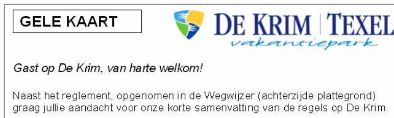
Figuur 4: Fragmenten van de 'gele kaart' van camping De Krim te Texel

De camping reikt bij binnenkomst een zogenaamde 'gele kaart' uit (zie figuur 4). Hierop staan de belangrijkste regels voor jongeren op de camping kort uitgelegd. Een medewerker van de camping bezoekt de jongeren heel bewust persoonlijk op hun standplek. Voor de jongeren is dit een teken dat de camping goed overzicht houdt. Voor de camping is dit een manier om de jongeren beter in te kunnen schatten en ze nog eens te herinneren aan de regels en om een goed overzicht te houden waar op de camping welke jongeren kamperen. Ook probeert de camping overlast te beperken door een persoonlijke verstandhouding met de jongeren te creëren.